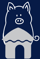
Maison de paille