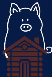
Maison de bois ronds