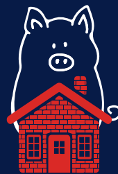
Maison de briques (maçonnerie)

Comme avec l'histoire des trois petits cochons, nos ancêtres recherchaient une façon durable de résister aux intempéries et de se protéger des prédateurs.